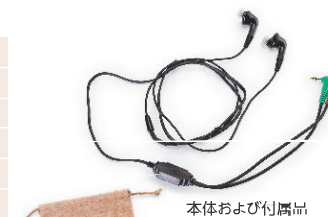
本体および付属品